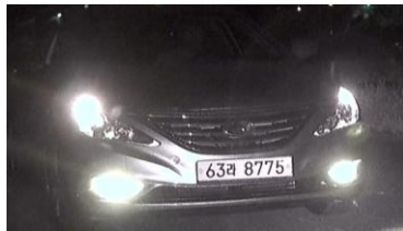
DVR 영상 캡처이미지